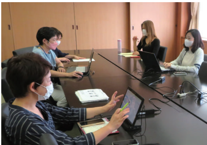
社員の3割弱が女性で、多くの方が子育てと仕事を両立して活躍中。

れたベンチャー企業です。テレビ放送の運行の自動化を担っていたBSN電子計算センターという会社が成長してBSNアイネットになりました。また、2021年7月にはブランドینگカンパニー「語れ。」も当社から誕生。このように新しいベンチャーが生まれることが大事で、そこに当社が成長できる可能性があります。