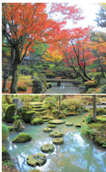
上／仙台石の橋から望む紅葉 下／石磨の北斗七星