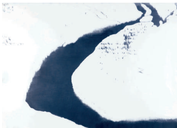
「信濃川・卯の木 A」1984年／P150