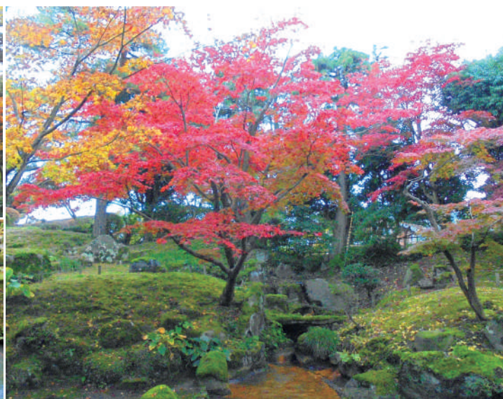
滝石組みと築山の山形石

所在地／柏崎市大字新道 5212-4 拝観料／一般・高校生以上：430 円、小・中学生：210 円 休館日／月曜日（月曜が祝日の場合は翌日）、12 月 1 日～翌年 3 月 31 日 問い合わせ先／0257-20-7120 詳細はホームページをご覧ください→ https://www.city.kashiwazaki.lg.jp/kanko_bunka_sports/bunka/iizukatei/10496.html