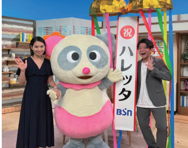
7,834 通の応募から選ばれた新キャラクターの名前は「ハレッタ」。デザインは上越市出身で NHK Eテレビみつけた!」のアートディレクターの大塚いちおさん。

与板の仏壇職人の家に生まれ、今も与板まつりのお囃子を聞くとワクワクするそうです。「会社に帰る」と言って奥様に呆れられるほど会社が大好き。かやぶき屋根の古民家に憧れ、20数年前に十日町市の古民家を譲り受け、時間を作って週末はそちらで過ごしています。毎年、かやを集め、屋根を直しながら住み続けて、大地の芸術祭の作家さんたちをお泊めしたこともあります。古民家には5000枚以上のレコードが置いてありますが、社長に就任した時に、良いものは独り占めしてはいけないと思い、約100年前の蓄音機をドナルド・キーン・センター柏崎に寄贈。センターでは月1回蓄音機コンサートが開かれて、その音色を響かせています。