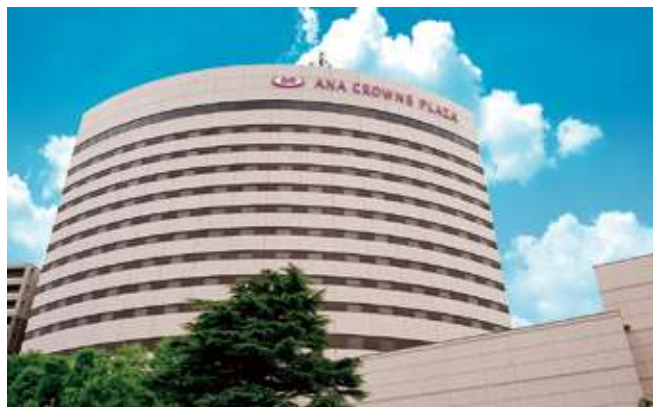
新潟市は例年、学会や様々なイベント、コンサートなどで人の往来がある。 その宿泊先として、国内外のお客様を迎えるANAクラウンプラザホテル新潟。

らっしゃいますので、当ホテルの宴会 ができる大会場で、みなさまから楽 しんでいただいております。