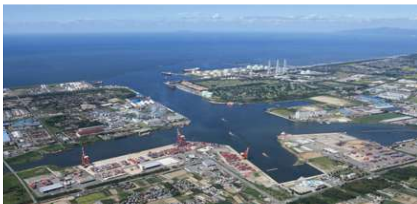
西港と東港の特性を活かし、国際交流の拠点となる新潟港。停泊する船舶は韓国航路や中国航路がメインでアメリカからは釜山港経由で新潟港へ。 新潟から、酒田、秋田、苫小牧などに寄港して中国や韓国へという航路をとります。