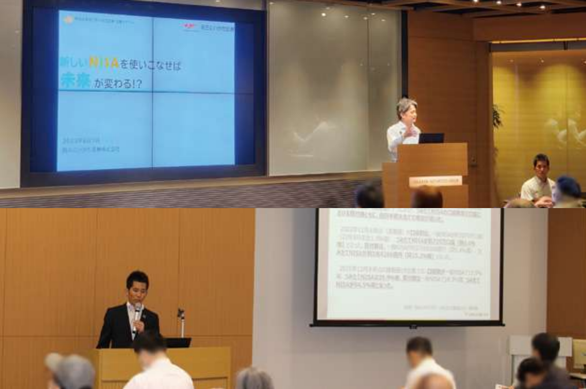
東京証券取引所 × 岡三にいがた証券 共同開催セミナー開催の様子 写真上/岡三証券室町本社 (2023年8月) 写真下/当社本店 (2023年9月)