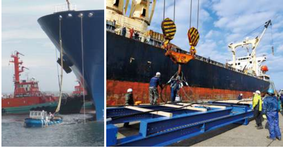
新潟港で港湾業務ができるのは3社のみ。危険物を積み込んだ船舶やタンカーなどが停泊する海上を巡回して港の安全を守ります。