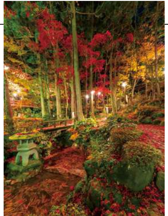
上/松雲山荘(ライトアップ)

10月から11月にかけてモミジやドウダンツツジの垣根が色づき、ライトアップも行われます。昼間とは違った幻想的な雰囲気を楽しめます。