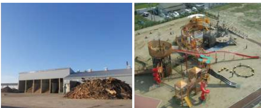
リンコーコーポレーションはCSR活動やSDGsにも積極的に取り組み、1985(昭和60)年に臨港木材リサイクルセンターを建設(写真左)。現在は県内最大級の木材リサイクル置き場面積を確保し木材リサイクル処理を行っています。市民に人気の山の下みなとランドは当社の「臨港埠頭」の土地の一部を新潟市に無償提供(写真右)。2022(令和4)年には、みなとSDGsパートナーに登録しました。

本間 会社として、2022年〜2024年度の中期経営計画として策定したのは、コンテナ貨物事業の強化、港湾運送事業の効率化と生産性アップです。臨港埠頭や不動