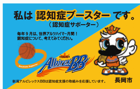
認知症ブースター(サポーター)カード

申込：9月5日(月)から長寿はつらつ課(0258-39-2268)へ電話か、フォームでお申し込みください。